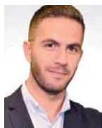
Γράφει ο Σταύρος Ιωαννίδης