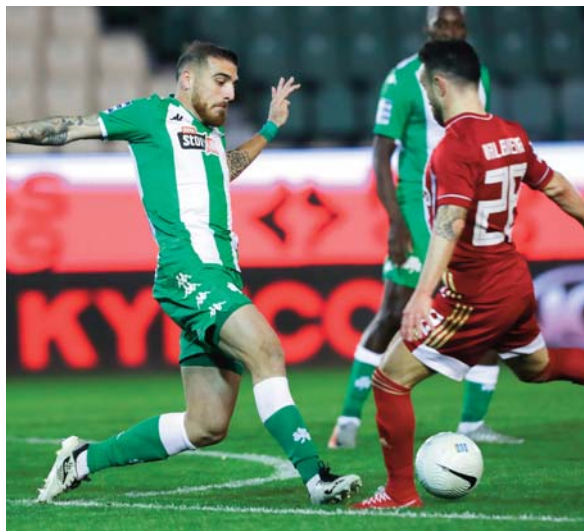
49, ΑΕΚ 48, Αστέρας Τρ. 43, Βόλος ΝΠΣ 35, ΠΑΣ Γιάννινα 34, Απόλλων Σμ. 29, Ατρόμητος 29, Λαμία 27, ΟΦΗ 23, Πανατωλικός 21, ΑΕΛ 20.

Τρεις ομάδες θα προκριθούν στο Conference League UEFA, ο δεύτερος και ο τρίτος της βαθμολογίας αλλά και ο κυπελλούχος. Θα υποβιβαστεί μία ομάδα και η προτελευταία θα δώσει αγώνες μπαράζ με τη δεύτερη της Super League 2. Το πρόγραμμα: Σάββατο: Βόλος - Πανατωλικός (15.00), Απόλλων Σμ. - ΟΦΗ (17.15), Ατρόμητος - ΑΕΛ (19.30). Κυριακή: Άρης - ΑΕΚ (15.00), Αστέρας Τρ. - ΠΑΟΚ (17.15), Ολυμπιακός - Παναθηναϊκός (19.30). Δευτέρα: ΠΑΣ Γιάννινα - Λαμία (19.30). Βαθμολογία (28 αγ.): Ολυμπιακός 73, Άρης 54, ΠΑΟΚ 50, Παναθηναϊκός