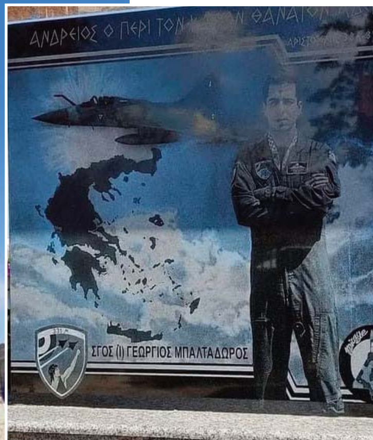
Ένα πολεμικό αεροσκάφος Mirage F-1CG και ένα μνημείο ως ελάχιστος φόρος τιμής στη θυσία του ήρωα πιλότου Γιώργου Μπαλταδώρου