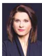
Γράφει η Αμαλία Κάζου

Κατ' αρχάς, αναφορικά με τον συμπληρωματικό ΕΝΦΑ το οικονομικό επιτελείο εξετάζει την κατάργησή του. Σημειώνεται ότι περίπου 450.000 φορολογούμενοι κάθε χρόνο καταβάλλουν διπλό φόρο ακινήτων, αφού επιβαρύνονται με τον ΕΝΦΙΑ βάσει των ισχύοντων συντελεστών και, παράλληλα, με επιπλέον φόρο που απορρέει από τους κλιμακωτούς