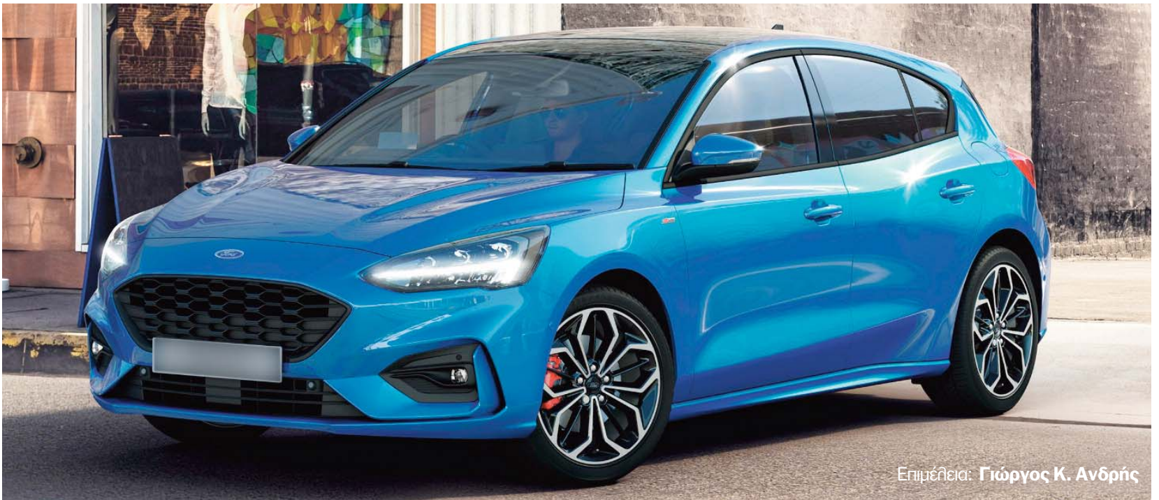
Επιμέλεια: Γιώργος Κ. Ανδρής