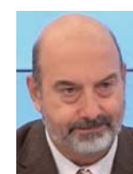
Γράφει ο Διαμαντής Σείτανίδης

Σε μεγάλο βαθμό η αξία των ευρημάτων έγκειται στο ότι αυτά είναι σε κατάσταση που φωτίζουν μια ολόκληρη εποχή: τα τείχη της πόλης βρέθηκαν σχεδόν άθικτα, ενώ εντοπίστηκαν και εργαλεία της καθημερινής ζωής. Ταυτόχρονα, τα αρχαιολογικά στρώματα της πόλης παρέμειναν άθικτα, με αποτέλεσμα να παρέχουν σημαντικές πληροφορίες για τη ζωή των