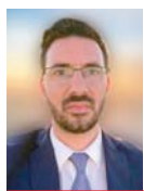
Γράφει ο Σπύρος Μουρελάτος

Κυβερνητικοί αξιωματούχοι εκτιμούν βασίμως ότι σε περίπτωση που το... πείραμα του