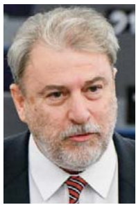
του Νότια Μαριά

Καθηγητής Θεσμών της Ευρωπαϊκής Ένωσης στο Πανεπιστήμιο Κρήτης, πρόεδρος του κόμματος Ελλάδα - Ο άλλος δρόμος, πρώην Ευρωβουλευτής