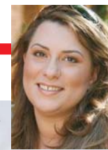
Γράφει η Γεωργία Κουμπούνη