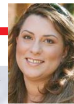
Γράφει η Γεωργία Κουμπούνη