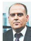
Γράφει ο Λουκάς Γεωργιάδης

Το Ταμείο ζητεί από τον έναν και μοναδικό ενδιαφερόμενο επενδυτή που προκρίθηκε (δεν ανακοινώθηκε το όνομα) να προχωρήσει σε βελτιωμένη προσφορά, προκειμένου να αποκτήσει το 65% που κατέχει το ΤΑΙΠΕΔ και το 35% που κατέχουν τα Ελληνικά Πετρέλαια στη ΔΕΠΑ Υποδομών. Ενδιαφερόμενοι για την απόκτηση της εταιρείας ήταν η ιταλική Italgas και η τσεχική EPH, ενώ στον πρώτο γύρο του διαγωνισμού είχαν συμμετάσχει οι First State Investments, KKR, Macquarie και η κινεζική κοινοπραξία SINO-CEE FUND & Shanghai Dazhong Public Utilities (GROUP), χωρίς ωστόσο να υποβάλουν δεσμευτικές προσφορές. Το ΤΑΙΠΕΔ προέκρινε την εταιρεία που προσέφερε τίμημα κατά 15% υψηλότερο από τη δεύτερη. Έτσι, η προθεσμία που έχει ο πλειοδότης για να βελτιώσει την προ-