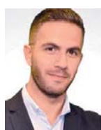
Γράφει ο Σταύρος Ιωαννίδης

Στον βυθό του Αιγαίου πέφτουν οι δεσμεύσεις της Άγκυρας για «ήρεμα νερά» στα ελληνοτουρκικά. Οι γείτονες, με αφορμή το Μεταναστευτικό αλλά και με την πάγια ατζέντα των παράνομων διεκδικήσεών τους, ανεβάζουν σταδιακά την ένταση, δείχνοντας ότι οδεύουμε σε «θερμό» φθινόπωρο.