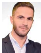
Γράφει ο Σταύρος Ιωαννίδης

Η Ελλάδα διαθέτει αυτή τη στιγμή 25 ελικόπτερα αυτού του τύπου, ο ρόλος των οποίων είναι νευραλγικός τόσο σε καιρό ειρήνης όσο και σε καιρό κρίσης. Η καθοριστική συνδρομή τους στην αντιμετώπιση των δασικών πυρκαγιών του Αυγούστου ανέδειξε την ανάγκη διατήρησης υψηλών διαθεσιμότητων του ελικοπτέρου που