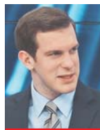
Γράφει ο Γιώργος Ευγενίδης

Σύμφωνα με διασταυρωμένες πληροφορίες της «Political», η κυβέρνηση καταλήγει μάλλον σε ένα σχήμα με υπουργό και υφυπουργό στο εν λόγω υπουργείο και, σύμφωνα με ανώτερη κυβερνητική πηγή, θα πρόκειται για πρόσωπο με «θετικό πρόσημο» και ευρεία αποδοχή. Μάλιστα, από προχθές υπάρχει στα σκαριά το όνομα του ανθρώπου που θα αναλάβει τα νηπιά, αλλά έμενε να γίνουν οι τελικές συνεννοήσεις, προκειμένου να μην υπάρξει επανάληψη της περίπτωσης Αποστολάκη. Το εν λόγω πρόσωπο, σύμφωνα με το βασικό σενάριο, έχει επιχειρησιακά χαρακτηριστικά, ενώ θα υποστηρίζεται από έναν υφυπουργό που θα έχει διαφορετικά χαρακτηριστικά που μένει να φανεί αν θα είναι πο-