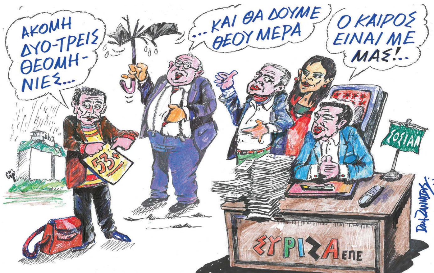
Διάγραμμα Αντώνη Ζαννίδη