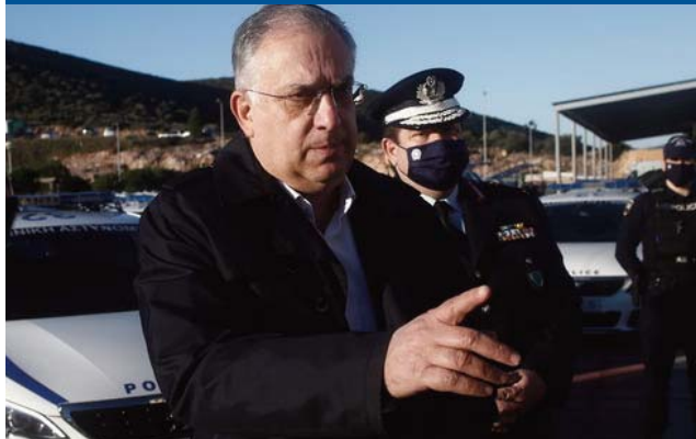
Παρουσία του υπουργού Προστασίας του Πολίτη Τάκη Θεοδωρικάκου η παραλαβή 113 νέων περιπολικών

Νέα ενίσχυση για τον στόλο οχημάτων της ΕΛΑΣ, καθώς το πρωί της Δευτέρας παρελήφθησαν για λογαριασμό της Άμεσης Δράσης σε Αττική και Θεσσαλονίκη 113 νέα περιπολικά οχήματα. Η τελετή παραλαβής έγινε στις εγκαταστάσεις της Αστυνομίας στο Μαρκόπουλο, παρουσία του υπουργού Προστασίας του Πολίτη Τάκη Θεοδωρικάκου, ο οποίος ανέφερε: «Θα βοηθήσουν (σ.σ.: τα νέα περιπολικά) τους αστυνομικούς μας να κάνουν ακόμη καλύτερα τη δουλειά τους, όπως έγινε τις τελευταίες μέρες με τους τέσσερις αστυνομικούς που έσωσαν μια γυναίκα την τελευταία στιγμή στη Θεσσαλονίκη και με τη σύλληψη οκτώ ατόμων για ναρκωτικά στο Ζεφύρι και στα Λιόσια. Υπάρχουν και δεκάδες άλλες περιπτώσεις σε όλη τη χώρα που αποδει-