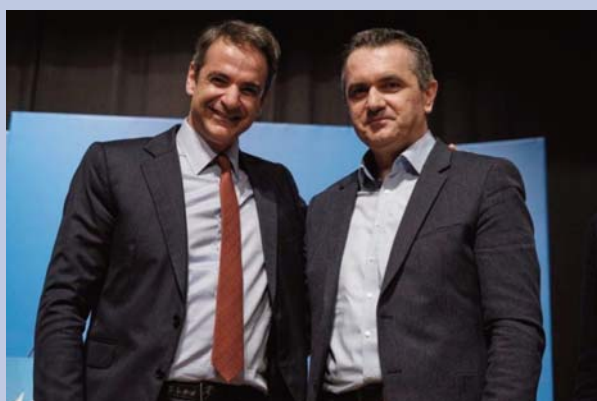
Ο Κυριάκος Μητσοτάκης με τον περιφερειάρχη Δυτικής Μακεδονίας Γιώργο Κασαπίδη

Συγκεκριμένα ο κ. Κασαπίδης επισήμανε: «Η πρόταση του "White Dragon" είναι μια σύμπραξη και συνεργασία μεγάλων ενεργειακών ομίλων της Ελλάδας με αφορμή την πρόταση που είχα υποβάλει το 2019 για λογαριασμό