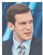
Γράφει ο Γιώργος Ευγενίδης

Υ πό τον φόβο της μετάλλαξης Όμικρον, η κυβέρνηση παίρνει κι άλλα μέτρα για τα ρεβεγιόν της Πρωτοχρονιάς, στα οποία και οι εμβολιασμένοι πολίτες θα καλούνται πλέον να πηγαίνουν με τεστ.