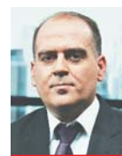
Γράφει ο Λουκάς Γεωργιάδης

Χθες, η τιμή του φυσικού αερίου υποχώρησε σε επίπεδα κοντά στα 65 ευρώ ανά μεγαβατώρα, έναντι 180 ευρώ στις αρχές Δεκεμβρίου, κάτι που σε πρώτη φάση εκτονώνει την ανεξέλεγκτη αύξηση του προηγούμενου διαστήματος και σε επόμενο στάδιο δείχνει τον δρόμο της σταθεροποίησης σε πιο... λογικά επίπεδα για τα συμβόλαια στο τέλος του τρέχοντος έτους. Η μείωση της τιμής του φυσικού αερίου, ως αποτέλεσμα