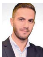
Γράφει ο Σταύρος Ιωννίδης

Η συμβολική τελετή έλαβε χώρα στα ιστορικά ναυπηγεία της Λοριάν παρουσία του Νίκου Παναγιωτόπουλου και του διευθυντή της ΓΔΑΕΕ Αριστείδη Αλεξόπουλου. Το ελληνικό κλιμάκιο ξεναγήθηκε στις εγκαταστάσεις της Group Naval από τη Γαλλίδα υπουργό Άμυνας Φλοράνς Παρλί και τον διευθύνοντα σύμβουλο του ναυπηγικού κολοσσού Έρικ Πομελιέ και είχε την ευκαιρία να διαπιστώσει από πρώτο χέρι την πρόοδο των εργασιών στη συναρμολόγηση της γαλλικής Belharrga, η οποία αναμένεται να «πέσει» στο νερό στα τέλη του 2023. Έναν χρόνο αργότερα, το 2024, θα έρθει η σειρά της πρώτης ελληνικής φρεγάτας για να ξεκινήσει τις δοκιμές