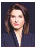
Γράφει η Αμαλία Κάτζου

Τ ο σενάριο να ανακοινωθεί δεύτερη παράταση για τη ρύθμιση των κορονοχρεών σε 32 έως 72 δόσεις εξετάζει το υπουργείο Οικονομικών. Όπως ανέφερε στην «Political» αξιωματούχος του ΥΠΟΙΚ, υπάρχει σκέψη να διευκολυνθούν περαιτέρω οι πληγέντες από την πανδημία και να τους δοθεί μία ακόμη ευκαιρία να ρυθμίσουν τις οφειλές τους.