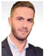
Γράφει ο Σταύρος Ιωαννίδης

Οι προκλητικές αναφορές και οι επιθέσεις σε πρόσωπα και θεσμούς της Ελληνικής Δημοκρατίας φαίνεται ότι αποτελούν τη νέα διπλωματική τακτική της Άγκυρας, η οποία στερούμενη επιχειρημάτων καταφεύγει στην εμπρηστική ρητορική και τις εθνικιστικές κορόνες.