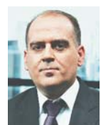
Γράφει ο Λουκάς Γεωργιάδης