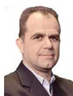
Γράφει ο Σωτήρης Σταθόπουλος

προκαλέσει έντονη ανησυχία στην κυβέρνηση, η οποία βλέπει πως, εκτός από τον πόλεμο στην Ουκρανία, ορισμένοι ποντάρουν στην κρίση κερδοσκοπώντας. «Χωρίς ουσιαστικά να υπάρχει αληθινό πρόβλημα παραγωγής, ποσότητας και τροφοδοσίας του καυσίμου, οι τιμές έχουν εκτοξευτεί κερδοσκοπικά με πρόσχημα την κρίση στην Ουκρανία», τόνισε ο πρωθυπουργός. Θέλοντας να στηρίξει τη συγκεκριμένη άποψη, ο Κυριάκος Μητσοτάκης υπενθύμισε ότι πριν από την ενεργειακή κρίση η τιμή του φυσικού αερίου ήταν στα 30 ευρώ ανά θερμική μεγαβατώρα και τώρα έχει φτάσει στα 300 ευρώ. «Αντιλαμβανόμαστε ότι ο εχθρός μας δεν είναι μόνο ο πόλεμος, αλλά μια βασική δυσλειτουργία με κερδοσκοπικά αίτια στην αγορά του φυσικού αερίου», συμπλήρωσε.