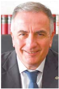
του Σταύρου Κατσαφάκη

Υφυπουργός Εσωτερικών, Βουλευτής Α' Θεσσαλονίκης