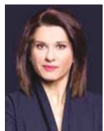
Γράφει η Αμαλία Κάζου

εκίνησε χθες η υποβολή αιτήσεων στη νέα δράση «Επιχορήγηση Επιχειρήσεων Παροχής Λογιστικών και Φοροτεχνικών Υπηρεσιών», που αφορά στην ενίσχυση αυτοασχολούμενων λογιστών - φοροτεχνικών, καθώς και νομικών προσώπων παροχής λογιστικών και φοροτεχνικών υπηρεσιών, ώστε να προσαρμόσουν τη λειτουργία τους με την αναβάθμιση/απόκτηση της απαραίτητης ψηφιακής υποδομής, να συνεχίσουν να παρέχουν απρόσκοπτα τις υπηρεσίες τους και να υποστηρίξουν την επιχειρηματική κοινότητα, τη δημόσια διοίκηση αλλά και τους πολίτες για να ανταποκρίνονται στις νέες συνθήκες που η πανδημία (Covid-19) δημιούργησε.