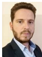
Γράφει ο Κώστας Παπάς

«Σήμερα είχαμε 7 λεπτά και στην αμόλυβδη 3-4 λεπτά. Κάθε μέρα έχουμε μια αυξητική τάση τέτοια που δεν την έχουμε ξαναδεί ποτέ. Το πετρέλαιο θέρμανσης ανέβηκε σε μια μέρα 7 λεπτά. Είναι τρομερές αυξήσεις. Δεν γνωρίζουμε αν και πότε θα φτάσει τα 2.5 ευρώ η τιμή της βενζίνης. Φαίνεται να είναι μονόδρομος η μείωση του ειδικού φόρου κατανάλωσης και του ΦΠΑ. Πρέπει να ακολουθηθεί το παράδειγμα της Κύπρου που και μικρότερους φόρους είχε από εμάς και, παρ' όλα αυτά, τους μείωσε. Πρέπει επίσης η Πολιτεία να λάβει υπόψη της τα αποθέματα που έχουν τα πρατήρια και να επιστραφεί εκεί ο ειδικός φόρος κατανάλωσης ή ο ΦΠΑ που τους αναλογεί, ώστε να λειτουργήσει η