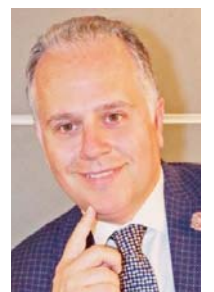
του Κων/νου Σ. Μαργαρίτη

Όλα τα θεσμικά όργανα της ΕΕ να στηρίξουν αυτές τις πρωτοβουλίες και να στείλουν μηνύματα αλληλεγγύης και συμπαράστασης στον δοκιμαζόμενο λαό της Ουκρανίας.