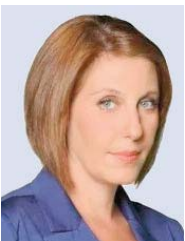
Της Ελληνς Τριανταφύλλου

Η ιστορική ρήση του ιδρυτή της Νέας Δημοκρατίας Κωνσταντίνου Καραμανλή «Εξω πάμε καλά» αποδεικνύεται διαχρονική.