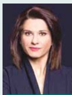
Γράφει η Αμαλία Κάτζου

Μ ε το ράλι στις τιμές των καυσίμων να συνεχίζεται χωρίς φρένα, η κυβέρνηση ετοιμάζεται να εξαγγείλει νέο πακέτο μέτρων-ανάχωμα στην ακρίβεια, την ίδια στιγμή που προετοιμάζει τον έκτακτο μηχανισμό παρέμβασης στις τιμές ηλεκτρικής ενέργειας, αλλά και νέα μέτρα εξοικονόμησης ενέργειας.