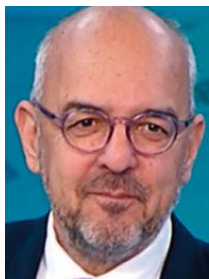
του Μπάμπη Παπαδημητρίου

Βουλευτής Β3 Νότιου Τομέα Αθηνών με τη ΝΔ, δημοσιογράφος