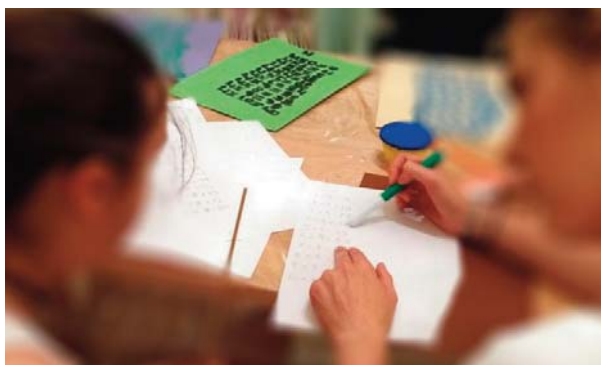
ραίτητων δικαιολογητικών (γνωμάτευση Κεντρικού Συμβουλίου Υγείας-ΚΕΣΥ).

Τα αιτήματα υποβάλλονται στις σχολικές μονάδες φοίτησης των μαθητών στο διάστημα αυτό και οι γονείς οφείλουν να καταθέσουν και το σύνολο των απα-