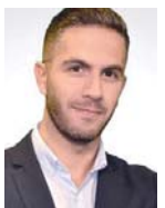
Γράφει ο Σταύρος Ιωνιδής

Α θήνα και Παρίσι εμβαθύνουν διαρκώς τη στρατηγική συνεργασία τους, επιβεβαιώνοντας το άριστο επίπεδο των διμερών σχέσεων. Εκτός από τα σημαντικά εξοπλιστικά προγράμματα, τα 24 Rafale, τις 3+1 φρεγάτες FDI Belharra και ενδεχομένως τις νέες κορβέτες του ελληνικού στόλου, οι δύο χώρες κάνουν σημαντικά βήματα στον τομέα της άμυνας, ενώ διαρκώς εμπλουτίζουν τον «χάρτη» των κοινών τους δραστηριοτήτων με ασκήσεις, συνεκπαιδεύσεις και προγράμματα που αγγίζουν ακόμη και τον τομέα του Διαστήματος.