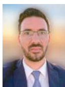
Γράφει ο Σπύρος Μουρελάτος