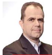
Γράφει ο Σωτήρης Σταθόπουλος

διεξαγωγής της πολιτικής αντιπαράθεσης είναι εξαιρετικά τοξικοί αλλά και γιατί τη στιγμή αυτή βρίσκονται σε μείζονα διακύβευση πάρα πολύ σημαντικά αγαθά για την Ελλάδα και την ελληνική οικονομία», τόνισε στον ΣΚΑΪ ο υπουργός Επικρατείας πυροδοτώντας νέο κύκλο εκλογικών σεναρίων.