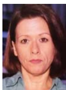
Γράφει η Ρεγγίνα Σαβούρδου

Το πλαίσιο επανεκκίνησης του σιδηρόδρομου παρουσίασε ο υπουργός Επικρατείας, υπεύθυνος για θέματα Υποδομών και Μεταφορών, Γιώργος Γεραπετρίτης σε συνέντευξη που παραχώρησε στη Γενική Γραμματεία Ενημέρωσης και Επικοινωνίας.