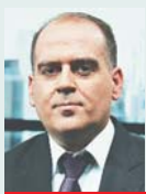
Γράφει ο Λουκάς Γεωργιάδης

Τ η μεγάλη ευκαιρία για τη νέα «πράσινη» εποχή στην οποία πρέπει να μεταβούν χιλιάδες μικρομεσαίες επιχειρήσεις σηματοδοτεί το πρόγραμμα χρηματοδότησης, ύψους 700 εκατ. ευρώ, του υπουργείου Ανάπτυξης και Επενδύσεων.