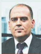
Γράφει ο Λουκάς Γεωργιάδης

Ω θηση στις μεταβιβάσεις ακινήτων δίνει η νέα απλοποιημένη διαδικασία έκδοσης της βεβαίωσης του Τέλους Ακίνητης Περιουσίας από τους δήμους, καθώς με τρία δικαιολογητικά οι ιδιοκτήτες ακινήτων θα μπορούν να διεκπεραιώσουν τις υποθέσεις τους.