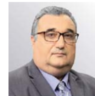
Του Γιάννη Αντύπα

Το «να μην τα φορτώσουμε όλα στον τελευταίο τροχό» δεν σημαίνει ότι πρέπει να κάνουμε ότι δεν βλέπουμε και δεν ακούμε τον σταθμάρχη «αμάν, τράκα!». Ούτε τον επιθεωρητή που... κούτσαινε και πήρε αναρρωτική έναν μήνα! Ούτε τον άλλο σταθμάρχη που πήγε για σουβλάκια. Για να μην τρελαθούμε εντελώς.