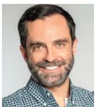
ΤΟΥ Φώτη Καρούδα

Η Παγκόσμια Ημέρα της Γυναίκας γιορτάζεται κάθε χρόνο στις 8 Μαρτίου. Η ιδέα για τον εορτασμό της προέκυψε κατά το πέρασμα στον 20ό αιώνα, το έναυσμα όμως είχε δοθεί αιώνες πριν, με τη Λουιστράτη να πρωτοστατεί σε μια απεργία