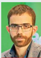
Γράφει ο Μιχάλης Μαστοράκης

Τέσσερις θέσεις πιο ψηλά βρέθηκε η Ελλάδα τον Φεβρουάριο, σε σχέση με τον προηγούμενο μήνα, στην κατάταξη του ΗΕΡΙ, του δείκτη τιμών ενέργειας για οικιακή χρήση που προσδιορίζεται σε μηνιαία βάση από τις Ρυθμιστικές Αρχές Ενέργειας της Αυστρίας και της Ουγγαρίας, σε συνεργασία με την εταιρεία VaasaETT.