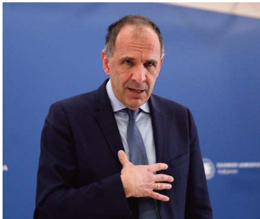
Μέτρα και κανόνες για την επανένταξη λειτουργίας των σιδηροδρομικών μεταφορών ανακοίνωσε ο Γεραπετρίτης