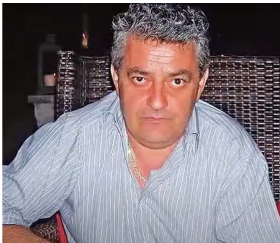
Ο προφυλακισμένος σταθμάρχης έβαλε στο κάδρο των ερευνών ακόμη τρία πρόσωπα του ΟΣΕ

Σημαντική ώθηση στις έρευνες θα δώσει το πόρισμα των πραγματογνωμόνων που