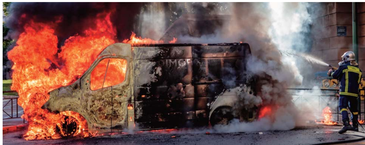
Τις πολυπληθείς συγκεντρώσεις σε Αθήνα, Θεσσαλονίκη και Πάτρα για τα θύματα των Τεμπών αμαύρωσαν οι συνήθεις μπαχαλάκηδες - Μολότοφ, πετροπόλεμος, φωτιές, συγκρούσεις με την Αστυνομία, χημικά και 15 συλλήψεις