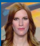
Γράφει η Γεωργία Γαραντζιώτη

Η απόδοση των οφειλόμενων τιμών σε ήρωες νεκρούς είναι πράγμα ιερό και όπου και αν κοι-