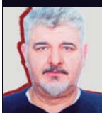
Γράφει ο Άθκης Φωτισόπουλος