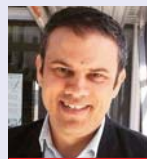
Γράφει ο Σπύρος Καπράριος

Την ώρα που οι μεταναστευτικές ροές αυξάνονται διαρκώς και η πίεση απειλεί πρωτίστως τις χώρες υποδοχής, η ισορροπία μεταξύ Βορρά και Νότου αναμένεται να καθορίσει σε σημαντικό βαθμό την επιτυχία των σχετικών προβλέψεων.