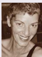
Σχόλιο Μαρία Δεδούση