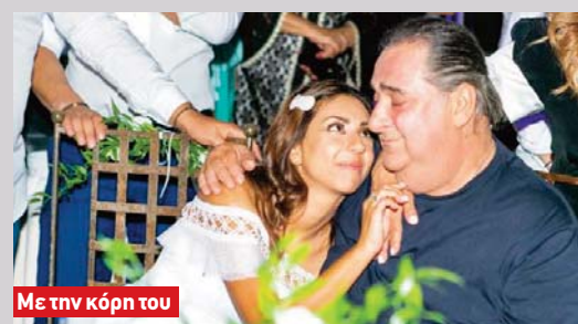
Με την κόρη του