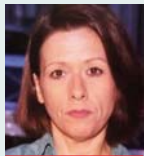
Γράφει η Ρεγγίνα Σαβούρδου

Ο τουρισμός αναμφίβολα συμβάλλει στην οικονομική σταθερότητα και την κοινωνική συνοχή και «πατά» στο όραμα και τη στρατηγική του υπουργείου Τουρισμού για τα επόμενα χρόνια. Ο σχεδιασμός και