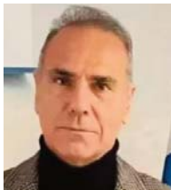
του Νίκου Ι. Σπανού

Ναύαρχος ΛΣ-ΕΛΑΚΤ (εα), πρώην δ/ντής Λιμένων - Λιμενικής Πολιτικής και Λιμενικής Αστυνομίας, διεθνής πραγματογνώμονας Επιστημών Ναυτιλίας, επικεφαλής επιθεωρητής ISO