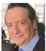
στον Νίκο Χιδίρογλου

«Ο τουρισμός είναι ένα ιδιαίτερα ευάλωτο προϊόν σε καταστάσεις γεωπολιτικής αναταραχής. Για αυτό και η Ελλάδα πρέπει να εκπέμπει πάντα το μήνυμα της ασφάλειας και της σταθερότητας», μας λέει ο πρώην υπουργός και βουλευτής Δωδεκανήσου της Νέας Δημοκρατίας Μάνος Κόνσολας.