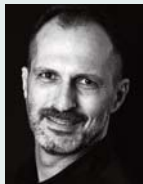
του Κωνσταντίνου Δαυλού

Γελοούσαν και τα «μουστάκια» του τέως υπουργού Οικονομικών Κωστή Χατζηδάκη κατά την παράδοση της σκυτάλης στον Κυριάκο Πιερρακάκη, καθώς οι τελευταίες του δηλώσεις ως «τσάρου της οικονομίας» συνδυάστηκαν και με την αναβάθμιση από την πολύ αυστηρή Moody's, τον μοναδικό οίκο αξιολόγησης που είχε διατηρήσει την Ελλάδα ένα σκαλοπάτι κάτω από την επενδυτική βαθμίδα. Ήδη οι άλλοι τέσσερις οίκοι τους οποίους αποδέχεται η Ευρωπαϊκή Κεντρική Τράπεζα μας είχαν αναβαθμίσει και μάλιστα πρόσφατα η Score και η DBRS μας ανέβασαν και στο δεύτερο σκαλοπάτι με επενδυτική βαθμολόγηση. Έτσι, η απόφαση της Moody's -του μεγαλύτερου όλων των οίκων παγκοσμίως- που έφερε την ελληνική οικονομία στο κλιμάκιο Baa3 από το Ba1 αφείρεσε από την οικονομία μας την τελευταία «ρετσινιά» της περιπέτειας της περασμένης δεκαετίας. Επιπλέον η Moody's άλλαξε και την προοπτική της Ελλάδας, από σταθερή σε θετική.