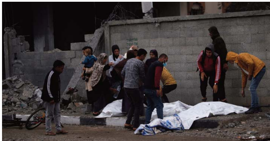
Πολλά γυναικόπαιδα έχασαν τη ζωή τους, εκατοντάδες οι τραυματίες, εκ των οποίων δεκάδες σε κρίσιμη κατάσταση - Οι Παλαιστίνιοι λένε ότι ο Νετανιάχου τορπίλισε τη συμφωνία εκκευρίας για να αποκτήσει πολιτικό σωσίβιο

Ο Σάαρ τόνισε ότι το Ισραήλ έχει υποστηρίξει τις προτάσεις του ειδικού απεσταλμένου του Αμερικανού προέδρου Ντόναλντ Τραμπ Στιβ Γουίτκοφ, οι οποίες θα διατηρήσουν την κατάπαυση του πυρός, υπογραμμίζοντας ωστόσο ότι «η Χαμάς τις απέρριψε δύο φορές». Αντιδράσεις υπήρξαν από τη διεθνή κοινότητα αλλά και από τη Ρωσία και την Κίνα. Η