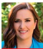
Γράφει η Αλέξια Τσουλιά

ανοίγει ο δρόμος για τη σύγκληση του Ανώτατου Συμβουλίου Συνεργασίας στην Άγκυρα. Η συνάντηση Γεραπετρίτη-Φιντάν διεξήχθη με το βλέμμα στραμμένο στη νέα συνάντηση του Έλληνα πρωθυπουργού Κυριάκου Μητσοτάκη και του Τούρκου προέδρου Ρετζέπ Ταγίπ Ερντογάν πιθανώς στις 8 Απριλίου.