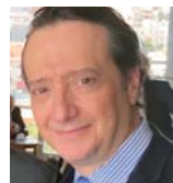
του Νίκου Χιδύρογλου

Ο διορισμός ως υφυπουργού Περιβάλλοντος και Ενέργειας του Νίκου Τσάφου προκάλεσε αντιδράσεις, λόγω της απαράδεκτης αναφοράς του -στο παρελθόν- στο Χ (πρώην Twitter) για τα Κατεχόμενα ως δήθεν «Τουρκική Δημοκρατία Βορείου Κύπρου». Ο ίδιος έσπευσε να απολογηθεί λέγοντας πως «η αντιπολίτευση μου επιτέθηκε επαναφέροντας μια