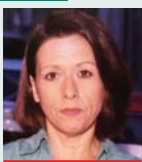
Γράφει η Ρεγγίνα Σαβούρδου

Τη διαβεβαίωση πως η εικόνα του ελληνικού σιδηροδρόμου έως το 2027 θα έχει αλλάξει ριζικά έδωσε ο πρωθυπουργός Κυριάκος Μητσοτάκης, κατά την επίσκεψή του στο υπουργείο Υποδομών και Μεταφορών. Το εγχώριο σιδηροδρομικό δίκτυο από την Αθήνα έως τη Θεσσαλονίκη θα αναβαθμιστεί πλήρως και θα καταστεί ασφαλές επιβεβαίωσε ο πρωθυπουργός, ο οποίος συνοδευόταν από τον αντιπρόεδρο της κυβέρνησης Κωστή Χατζηδάκη, μιλώντας στη νέα ηγεσία του υπουργείου Υποδομών και Μεταφορών.